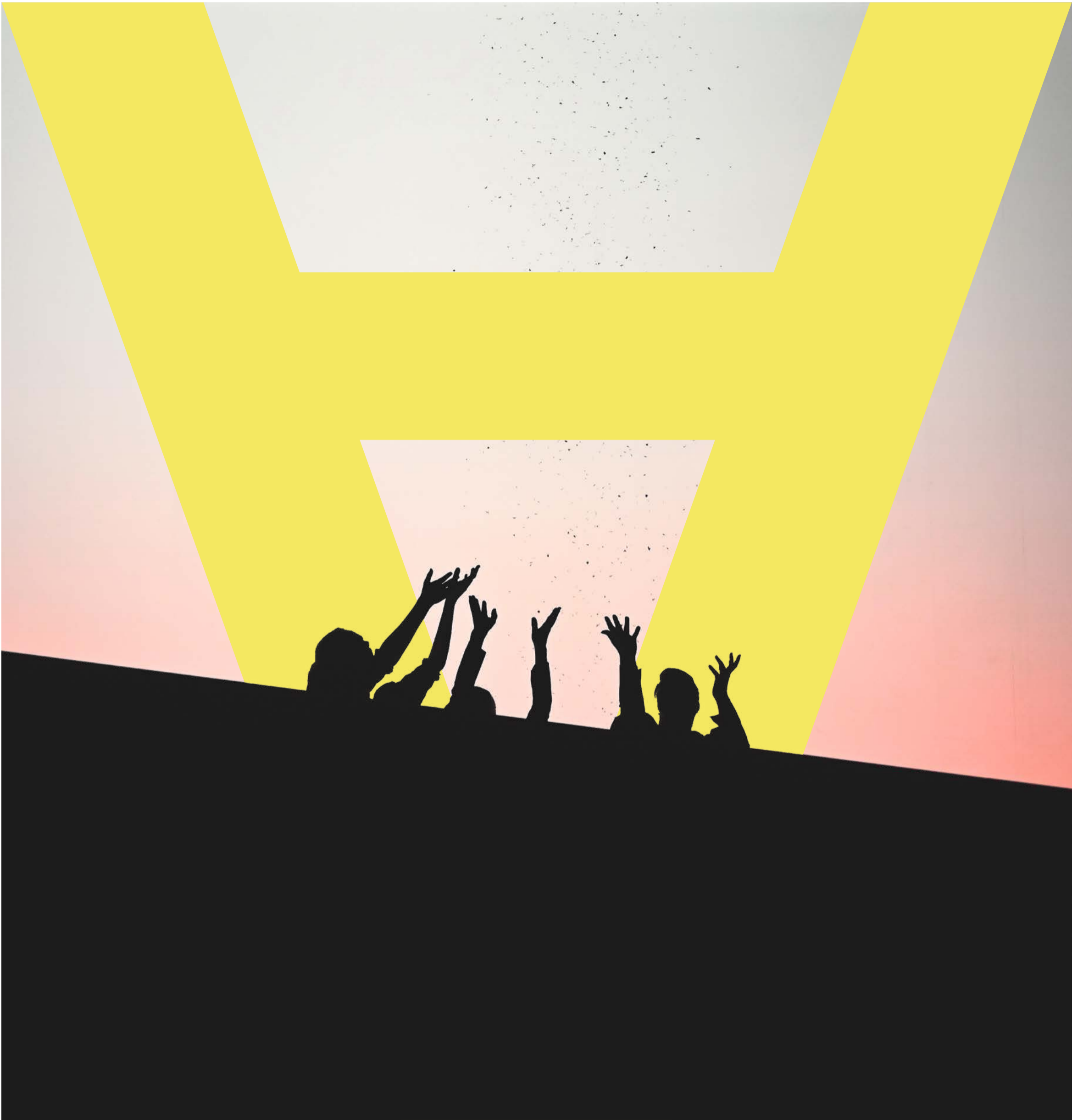
»Die Kunst der Freude«